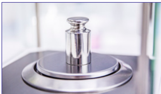
Fornita con Massa campione in classe di precisione E2, per la taratura e la verifica