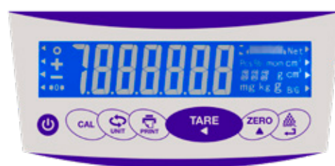
Tastiera e display