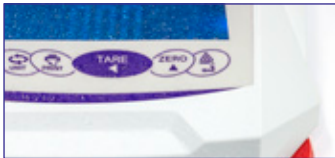
Tastiera a tenuta di spruzzi