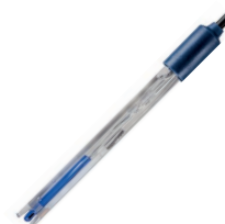
201 T DHS

Elettrodo digitale di pH combinato con tecnologia DHS. Sensore di temperatura incorporato. Corpo in plastica per usi generali. Esente da manutenzione. pH: 0...14 - T: 0...60 °C cod: 32200103