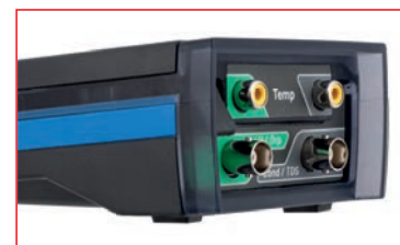
Il guscio semitrasparente protegge i connettori