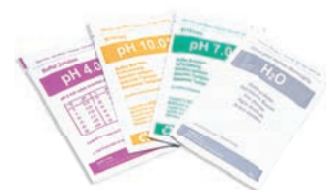
Soluzioni di taratura

Cella di conducibilità in epoxy, C=1 sensore di temperatura incorporato, cavo fisso 1 m. Campo di lavoro 10 \mu S...200 mS cod: 50004002