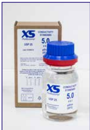
Standard conducibilità 5 µS/cm con certificato DANAK/DFM