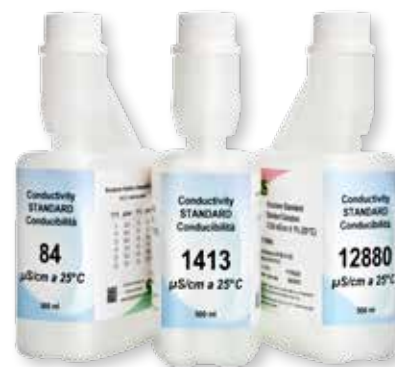
Con certificato riferibile NIST