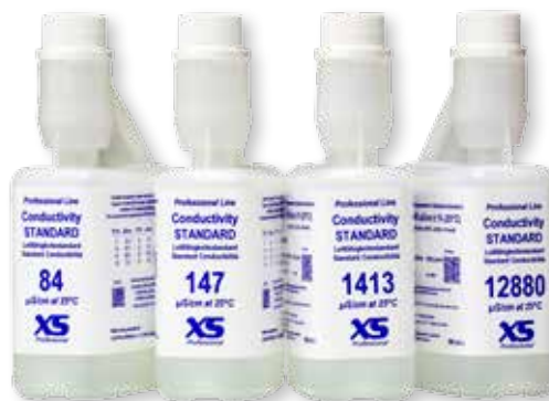
Con certificato DANAK/DFM