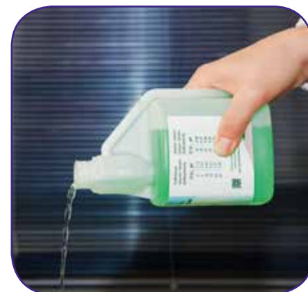
Svuotare il comparto di taratura