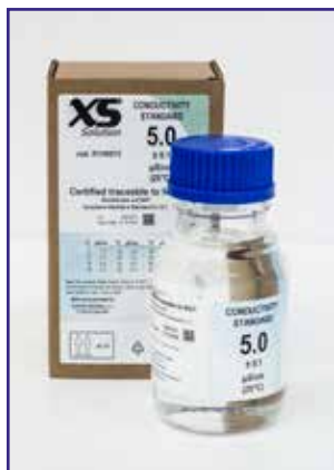
Standard conducibilità 5 µS/cm con certificato riferibile NIST