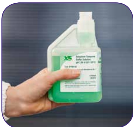
Riempire il comparto di taratura con una pressione sulla bottiglia